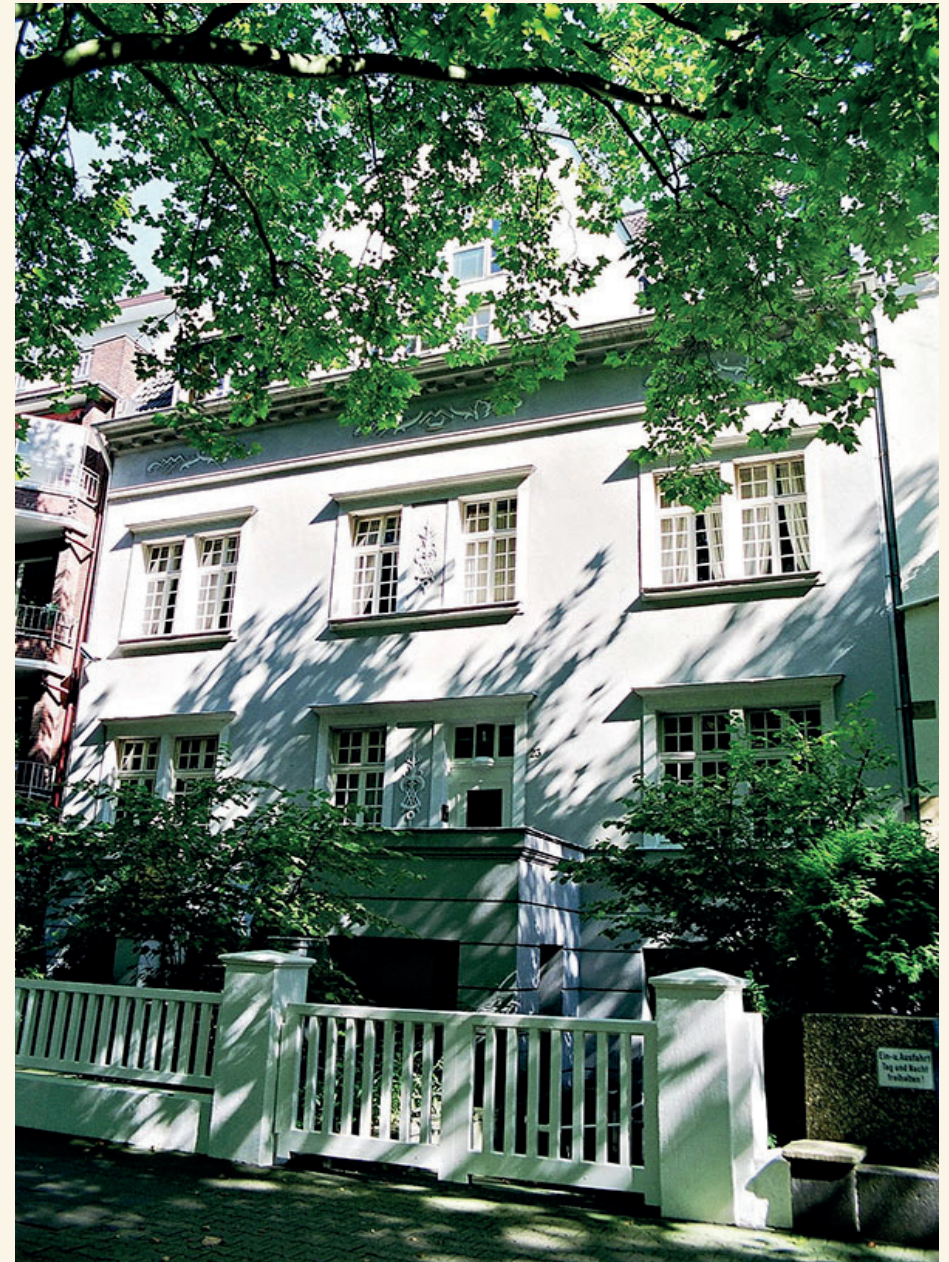
Firmensitz, Achenbachstr. 23 in Düsseldorf