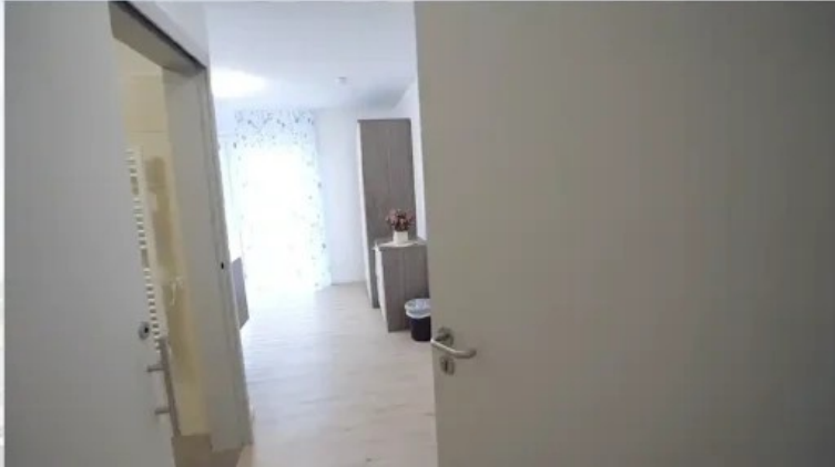
Bildschirmfoto 2025-04-23 um 13.51.25