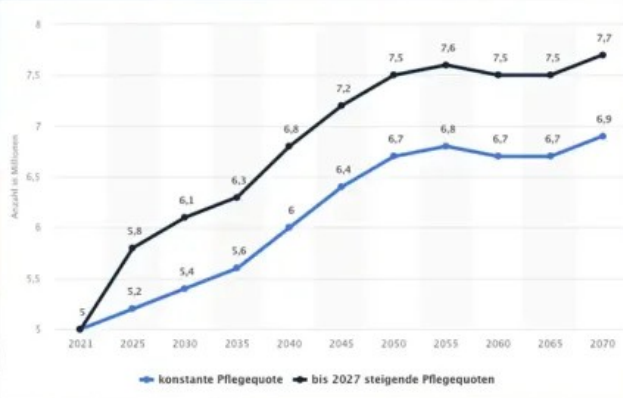
Bildschirmfoto 2025-04-23 um 13.51.34

Prognostizierte Anzahl von Pflegebedürftigen in Deutschland im Zeitraum der Jahre von 2021 bis 2070 (in Millionen)