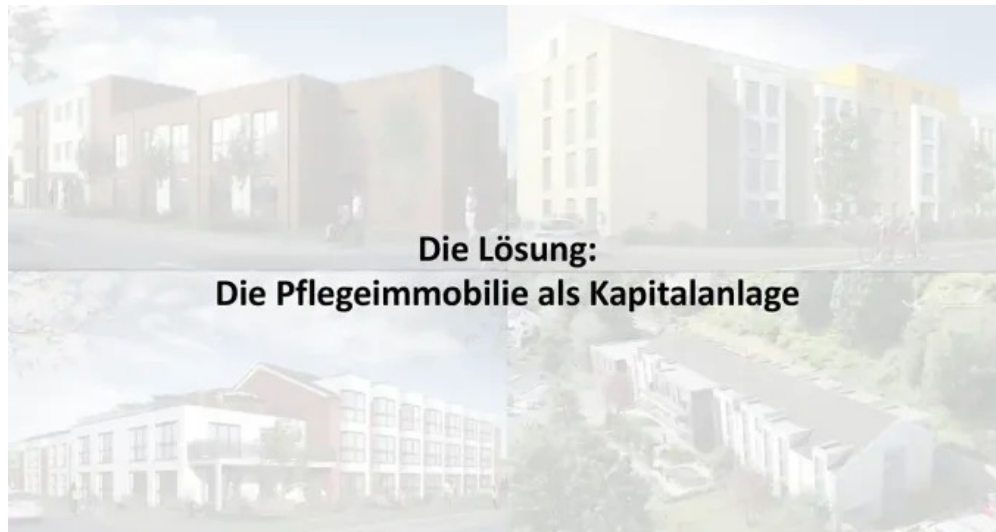
Bildschirmfoto 2025-04-23 um 14.21.34