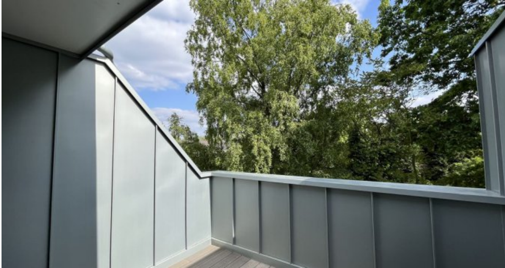
Muster Balkon – Visualisierung